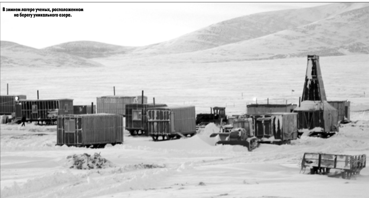
В зимнем лагере ученых, расположенном на берегу уникального озера.

Екатерина ТИММ. Фото из архива Чукотского УГМС.