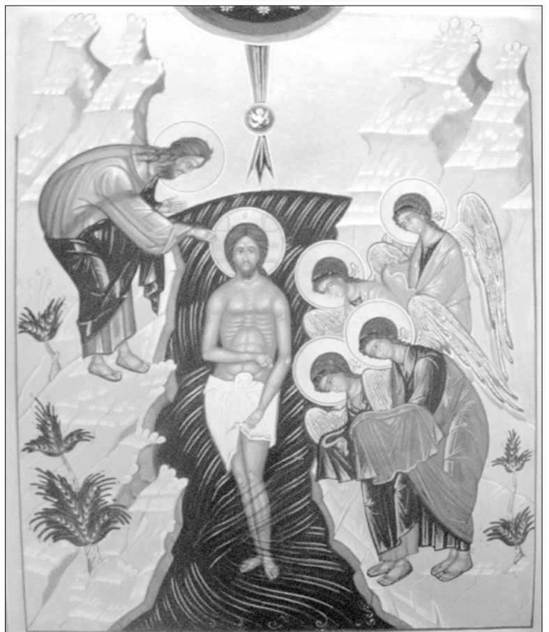
Икона «Крещение Господне» из Свято-Успенского храма г.Певека.